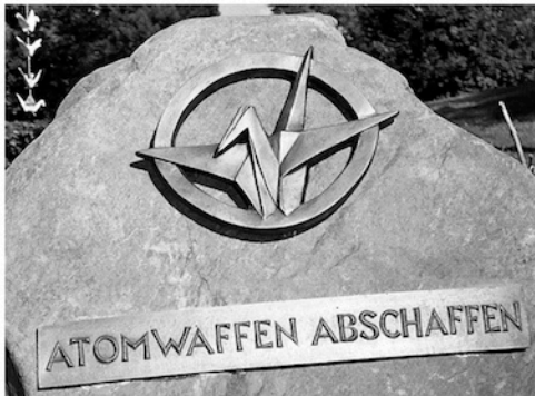
5. August 2007

Gedenken reicht nicht atomwaffenfrei jetzt!